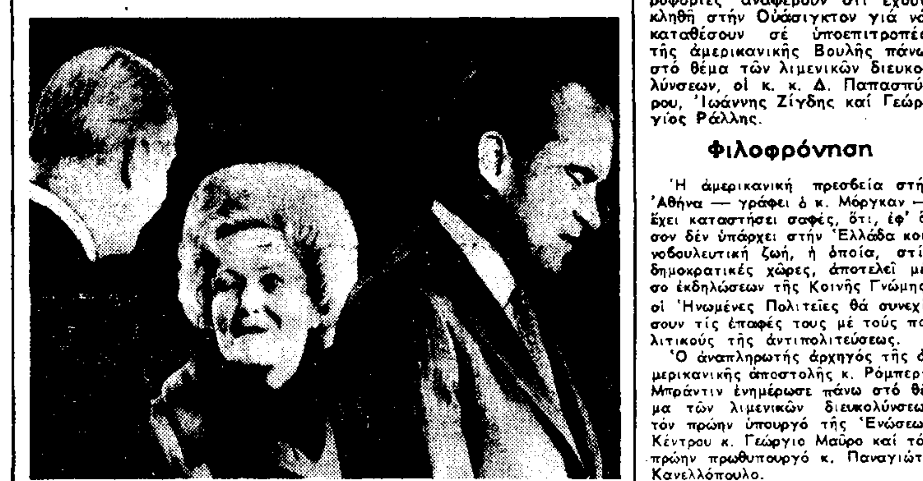
Από την άριση του προέδρου ζεύγους των Ηνωμένων Πολιτειών στο αεροδρόμιο της Ουάσινγκτον...